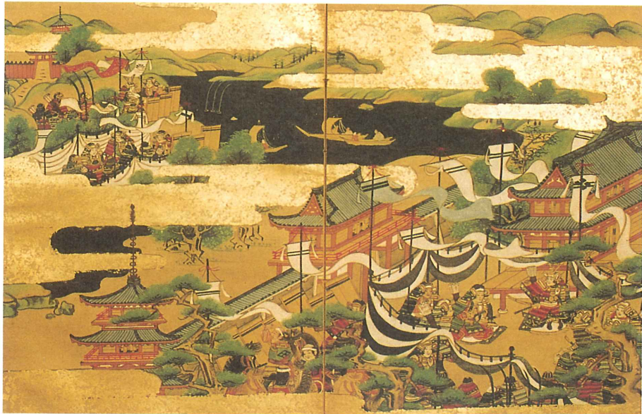
第8回特殊資料展 出展資料『絵入太平記』より 正平7年3月八幡合戦事（太平記巻31）の場面