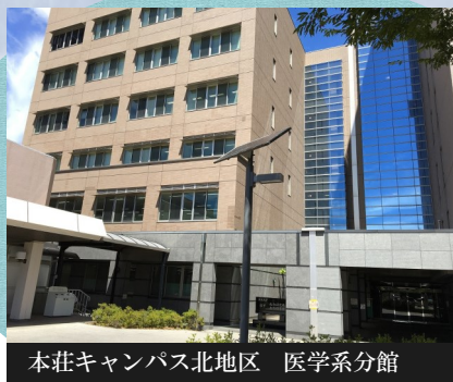
本荘キャンパス北地区 医学系分館

その意味では、図書館の古くからのあり方も捨て難いものです。本の森をさまよい、ふと手に取った一冊の本に、思いがけず世界が広がり、悩みから解放され、それからの人生を照らしてくれるような、そういう出会いの場としても、これからの図書館がありつづけたらよいなと思っています。