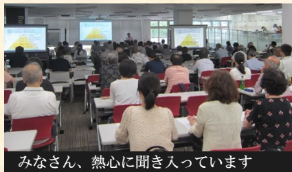
みなさん、熱心に聞き入っています