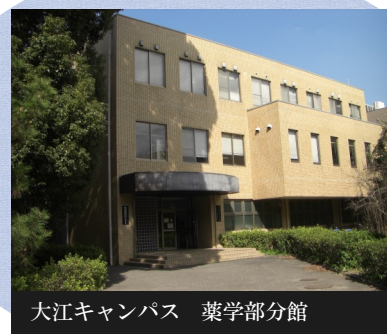
大江キャンパス 薬学部分館

薬学系に特化した図書館で、主に大江キャンパスの学生・教職員へのサービスを行っています。