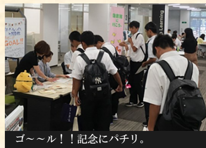
ゴ〜〜ル!! 記念にパチリ。

館内ラリーでは、ゴールすると図書館の極秘(?)情報満載の「うちわ」などくまぼんグッズが手に入ることもあって、ラリーシート片手に館内のあちこちで楽しい会話が広がったようです。「くまぼんと写真を撮ろう」コーナーでは、普段は撮影お断りのくまぼんと一緒に写真を撮ることができました。真夏の太陽にもまけない熱気あふれる高校生諸君との交流で、くまぼんもさらにパワー充電できたようです。くまぼん、一日お疲れ様。また熊大生になった皆さんと再会できるといいね。