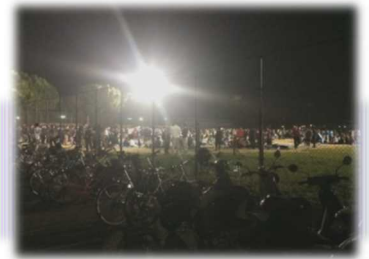
【武夫原へ避難してきた人々】

学修機会確保のために、地道な復旧作業によって5月2日には図書館の一部エリアの利用を再開することができました。まだこの頃は余震が頻発する中での開館でしたが、少しずつ日常が戻り始めました。