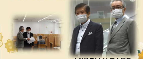
小川学長(左)と田中館長