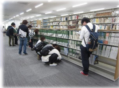
【資料を閲覧する学生】