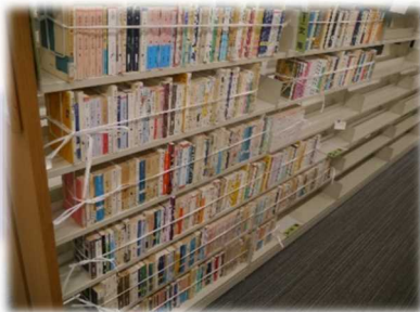
【本の転倒防止対策】

学修機会確保のために、地道な復旧作業によって5月2日には図書館の一部エリアの利用を再開することができました。まだこの頃は余震が頻発する中での開館でしたが、少しずつ日常が戻り始めました。