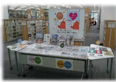
【公開直後の熊本地震ライブラリ】