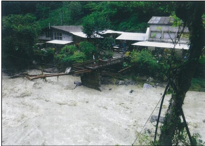
緑川(滝下) ※建物は緒方養魚場 進入路である手前の橋が一部を残して流出。