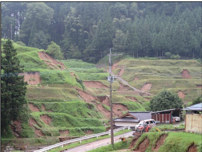
白小野 名ヶ地区 棚田斜面崩落