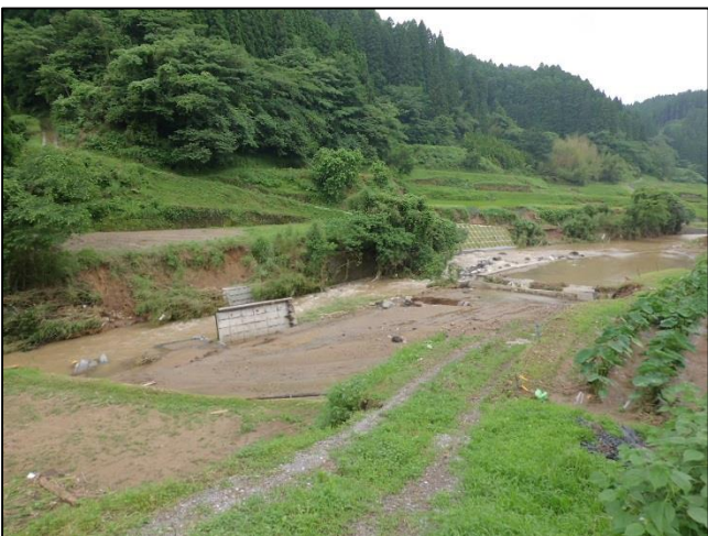
牧野 谷山地区 河川流出 ※河川手前は全て田