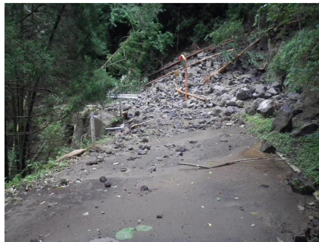
林道菊池人吉線 落石