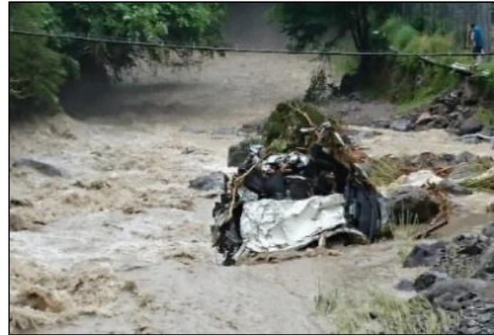
緑川(滝下) ※車両流出後、損壊