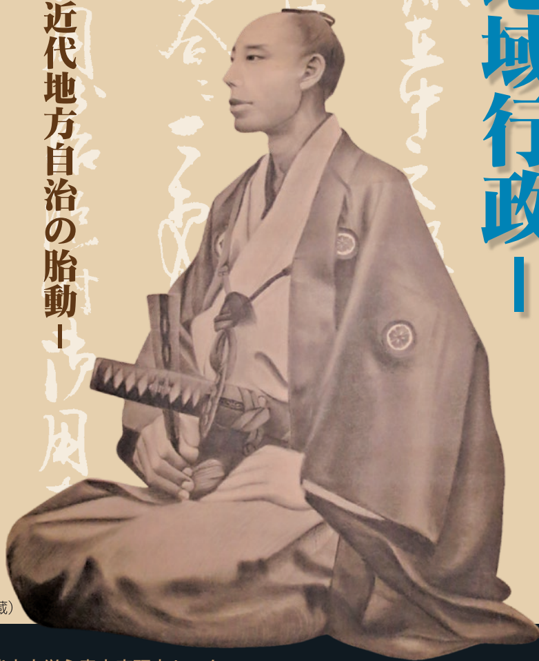
古閑忠右衛門 肖像画(個人蔵)