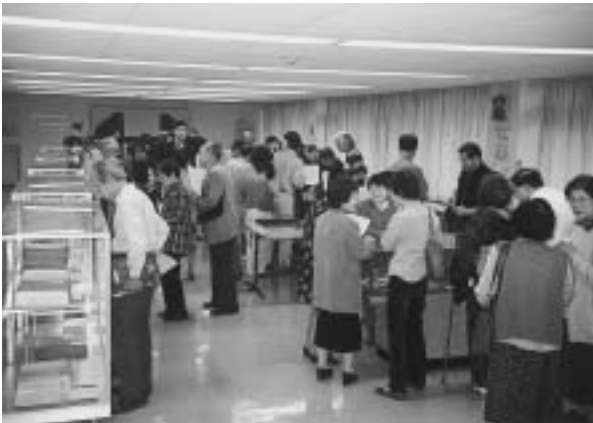
展 示 室