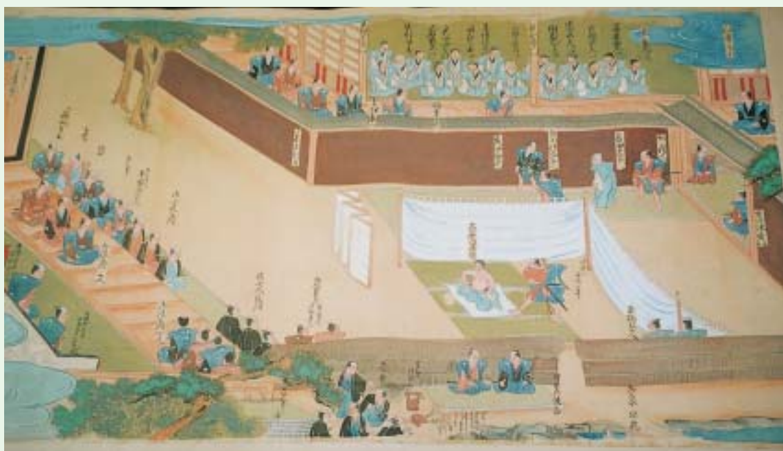
永青文庫熊本大学附属図書館寄託『義士切腹之図巻物』 元禄16年2月4日切腹を仰せつけられた義士に対し細川家では 丁重に扱い一人一人に畳三枚を取りかえたといわれている。