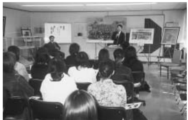
展 示 会 場